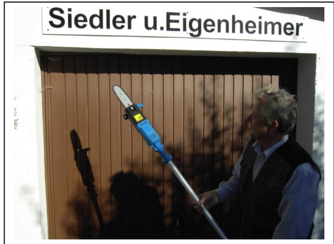
Hochentaster AST Kettensäge