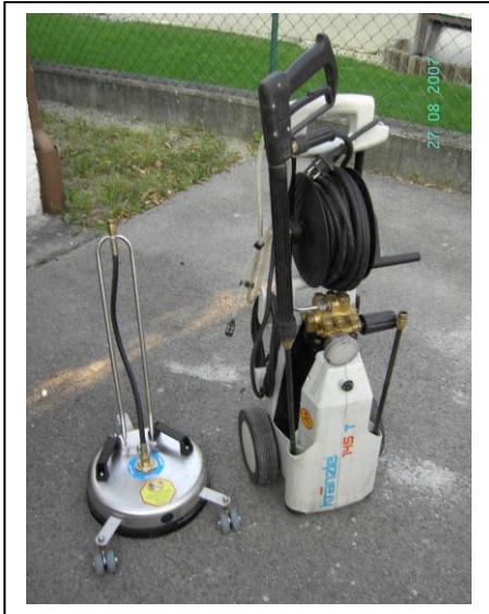
Hochdruckreiniger mit Flächenreiniger